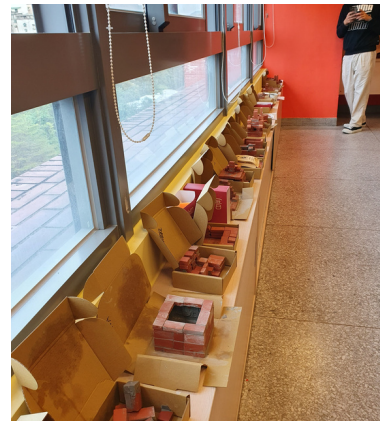
Taiwan Architecture DIY