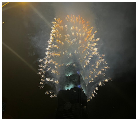
Silvester-Feuerwerk, Taipei 101