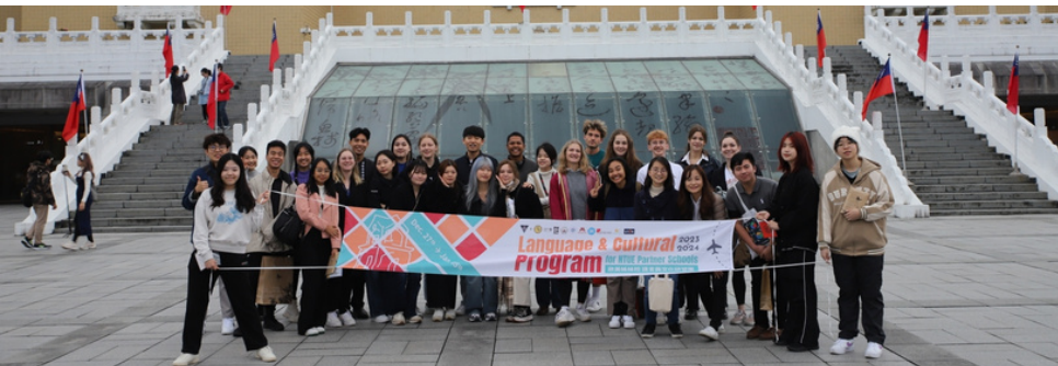
Ausflug ins National Palace Museum