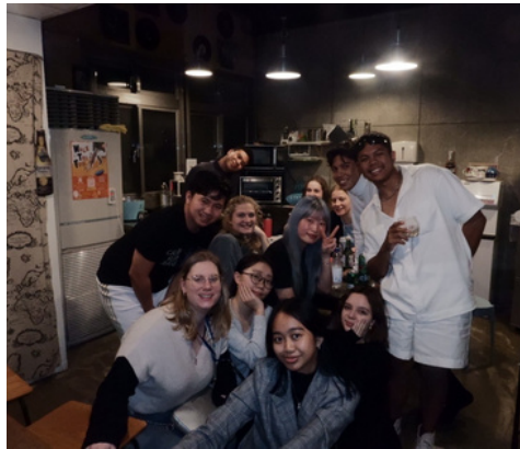
Abende im Hostel