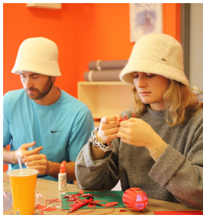
Paper Cut Decor DIY