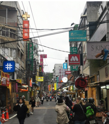
Cultural Tour Tamsui