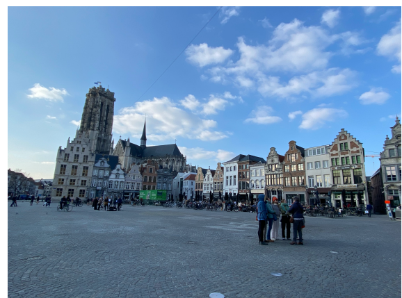
Grote Markt Mechelen

Uns hat die Woche in Belgien sehr gefallen. Wir konnten viele unterschiedliche Dinge im Bereich STEM ausprobieren und haben so unser Wissen im Bereich Naturwissenschaft und Forschung erweitern können. Zudem war der Austausch mit Studierenden aus anderen Ländern sehr bereichernd. Die Teilnahme an einer solchen einwöchigen Studienwoche der comenius weeks würden wir jeder Studentin und jedem Studenten weiterempfehlen, denn in nur einer Woche kann man so viel Neues lernen und profitieren für die Zukunft als Lehrperson sowie auch persönlich.