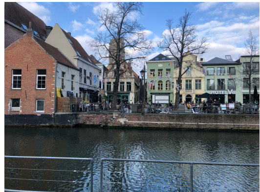
Vismarkt: Kleiner Platz mit Cafés

Für eine Woche durften wir drei für eine Studienwoche nach Belgien reisen, genauer gesagt nach Mechelen. Mechelen ist eine kleine Stadt ca. 20 Minuten von Brüssel entfernt. Ihr Charme hat uns von Anfang an begeistert. Es gibt viele schöne Häuser zu bestaunen, ein kleines Zentrum mit vielen tollen Einkaufsmöglichkeiten und Cafés. Von hier aus sei man schnell in unterschiedlichen Städten: Brüssel, Antwerpen, Amsterdam, Paris und sogar London. Ein Besuch ist aus unserer Sicht sehr empfehlenswert.